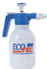
5076 PULVERISATEUR PRESSION PREALABLE JOINT VITTON 2 L