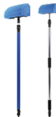
5040 /5040ALU KIT BROSSE QUADRO