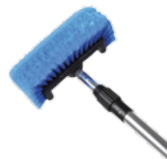
5041 Brosse Quadro