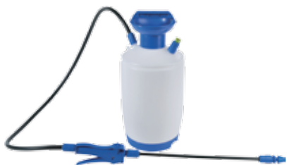
5078 PULVERISATEUR PRESSION PREALABLE JOINT VITTON 7L