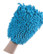
5062 GANT DE LAVAGE RASTA